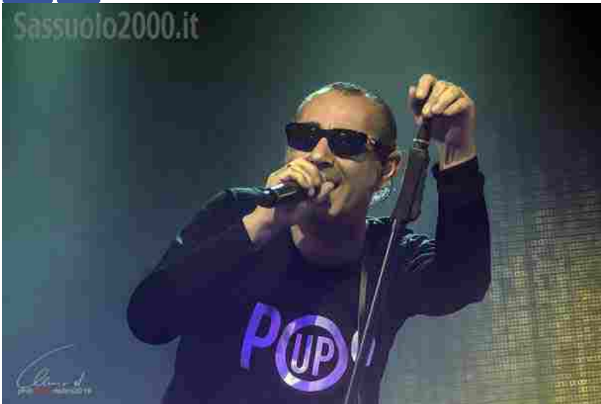
Sarà Luca Carboni con un concerto gratuito in piazza Grande offerto da Enel Energia nell'ambito di "EnergiaXlamusica" a chiudere la parte spettacolare di "Nessun dorma", che torna sabato 21 maggio, dal tardo

Like Share Sign Up to see what your friends like.